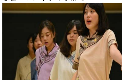
「牽罟」是一種臺灣古老的捕魚方式，利用魚群最密集靠岸的時候，用小船將漁網放至海中，魚群被圍住後岸上的人協力將魚網拉上來。圖為中山大學首創原創音樂劇《大海的女兒》劇中女子們在牽罟時跳舞。